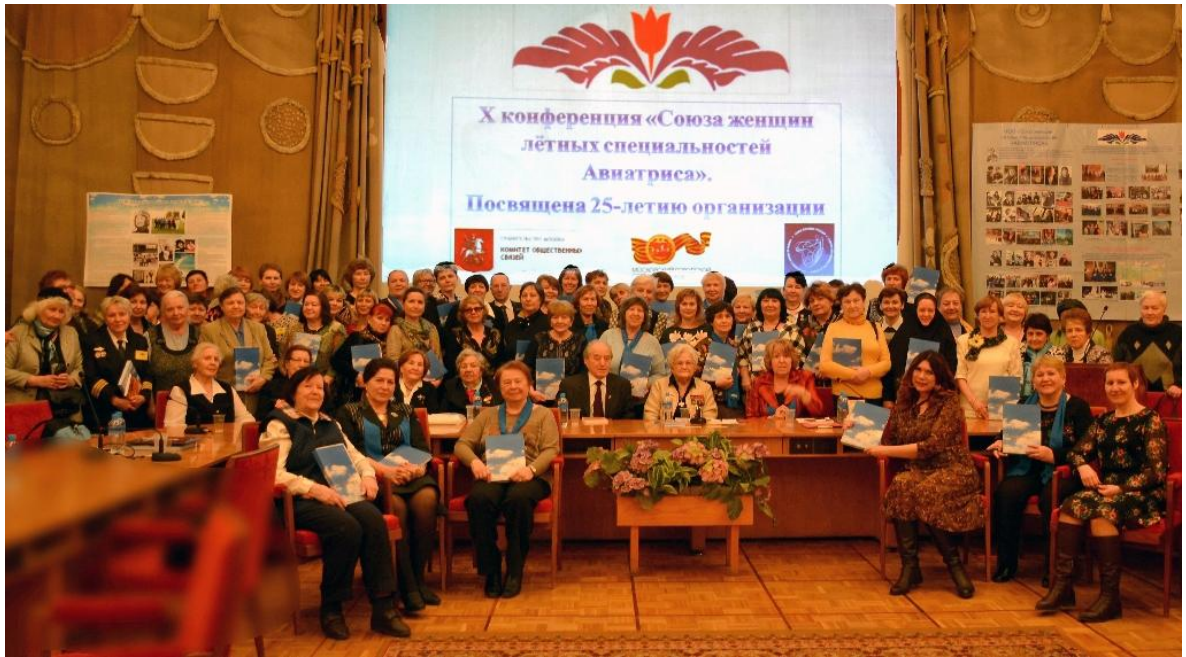
Женщины лётных специальностей и гости.

В этом году, 11 марта 2017 года исполнилось ровно 25 лет со дня создания Союза женщин лётных специальностей. Членами Союза являются более пятисот человек. Это лётчики-инструкторы российских аэроклубов и лётных училищ, лётчики гражданской авиации, лётчики-испытатели, испытатели-космонавты, военные лётчики и участники Великой