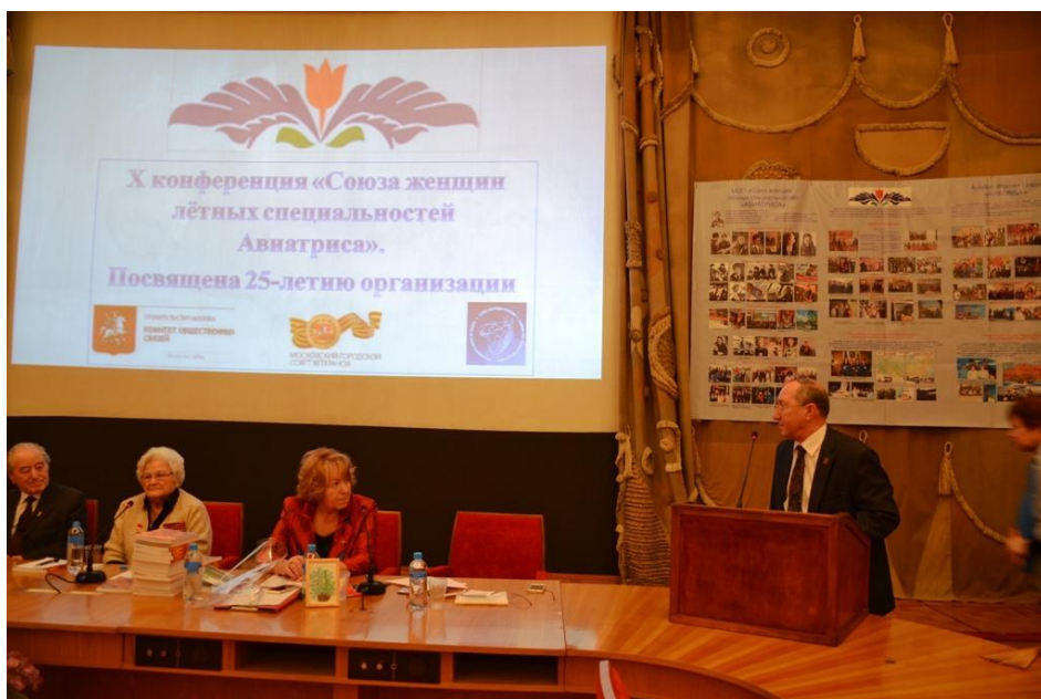
Мои поздравления с 25-летием Союза «Авиатриса»