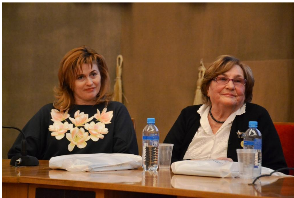
Слева Светлана Капанина – семикратная абсолютная чемпионка мира