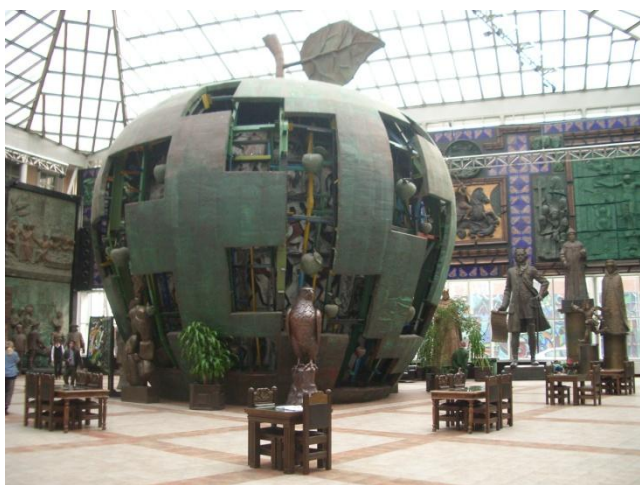
Монумент по библейским мотивам "Яблоко"

О Х.Макагоновой я впервые услышал в 1975 году, когда оканчивал институт в Ленинграде. Халидэ стала членом сборной СССР по самолётному спорту и вскоре показала свой спортивный характер и мастерство. Стала абсолютной чемпионкой мира по высшему пилотажу. В прессе часто появлялись статьи о российской лётчице. Она - многократная чемпионка мира, Европы, многократный победитель соревнований социалистических стран, победитель кубка Австралии, Заслуженный мастер спорта, судья международной категории. Имеет налет более 5000 часов. Освоила более 25 типов воздушных судов: - Як-18А, Як-18Т, Як-52, Як-55, Як-50, «Вильга», САР-10, Питц, Цесна-172S, «Экстра-300», Су-26, Су-29, Су-31, Z-326, Злин-50, Ан-2, вертолет «Робинсон - 44» , СМ-94, «Финист» СМ-92, СП-91, Корвет и др. Принимала участие в авиашоу в Австралии, Швеции, Швейцарии, Англии. Некоторое время тренировала сборную Испании по самолётному спорту. Была избрана Генеральным секретарём Федерации авиационного спорта России.