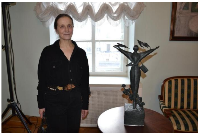
Скульптура к будущему памятнику лётчице, вернувшейся с войны. Скульптор А.Топтыгина.

Где женщина – Там и любовь и вера. Где женщина – Там нежность и мечты. И, если жизнь – Есть высшей сути мера, То женщина – Есть мера красоты.