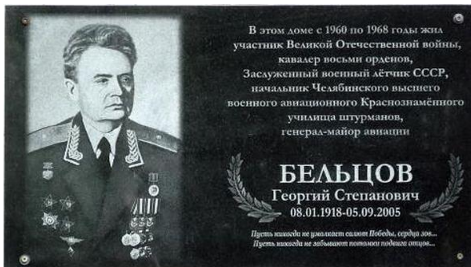
Мемориальная доска генерал-майору Aviации Г.С. Бельцову в Авиагородке-11 Челябинского ВВАКУШ

Георгий Степанович Бельцов умер 5 сентября 2005 года, похоронен в Щёлковском районе, Московской области.