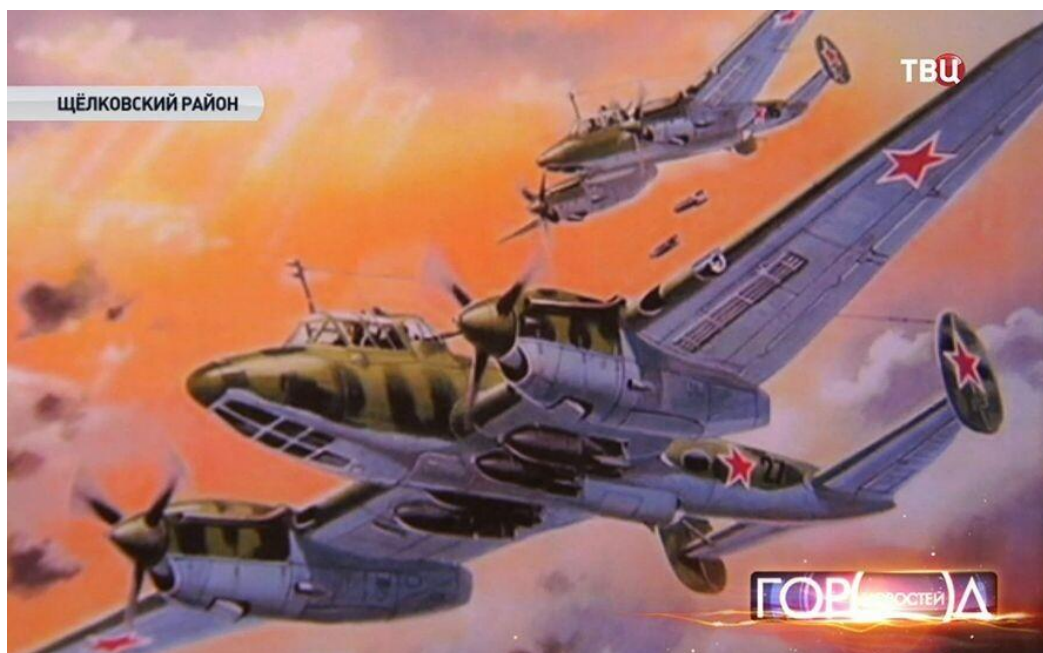
Пикирующие бомбардировщики Пе-2

после войны они поженились. С 13 октября 1943 года по 17 декабря 1943 года на Западном фронте, стажировался на командира авиационной эскадрильи при 96-м гвардейском бомбардировочном авиационном полку. С 7 июля 1944 года на 1-м Белорусском фронте.