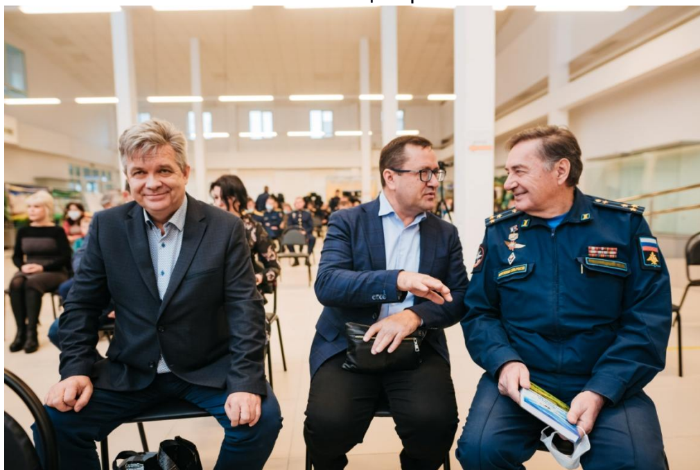
Полковник авиации Ю.П.Ресницкий с книгой «Диалоги с легендой авиации».

Ресницкий Юрий Петрович - Заслуженный военный лётчик, лётчик-испытатель 1 класса. 23 ноября 1990 года совершил перелёт вокруг Земного шара на самолёте "АН-124" Стартовал на аэродроме "Чкаловский", далее - Петропавловск - Камчатский - Мельбурн - Южный Полюс - Рио-де-Жанейро - Рабат - Северный Полюс - Елизово (Камчатка) - Мельбурн. За 72 часа 16 минут полёта было пройдено расстояние 50005 километров. С 1996 года по 2002 годы возглавлял Лётно-испытательный центр «Чкаловский».